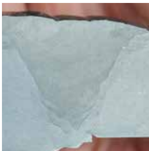
Arbeitsprobe mit Härtemessung in der Wärmeeinflusszone der Schweißnaht

Diese und weitere Schweißaufgaben werden durch eine Verfahrensprüfung in Zusammenarbeit mit dem TÜV Nord belegt und durch jährliche Arbeitsproben belegt. Makroskopische Untersuchungen (Schliffbilder), die Prüfung mechanisch-technologischer Eigenschaften der Schweißnahtverbindung sowie Härtemessungen und Härteverläufe werden durch unser Qualitätsmanagement sichergestellt.